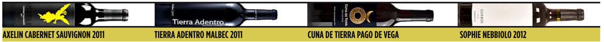
AXELIN CABERNET SAUVIGNON 2011