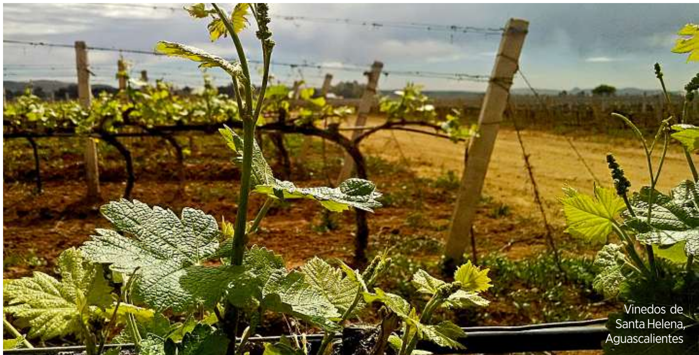
Vinedos de Santa Helena, Aguascalientes

Con tres años en el mercado y botellas premiadas en concursos internacionales, la joven vinícola Tierra Adentro se perfila como abanderada de la tierra zacatecana.