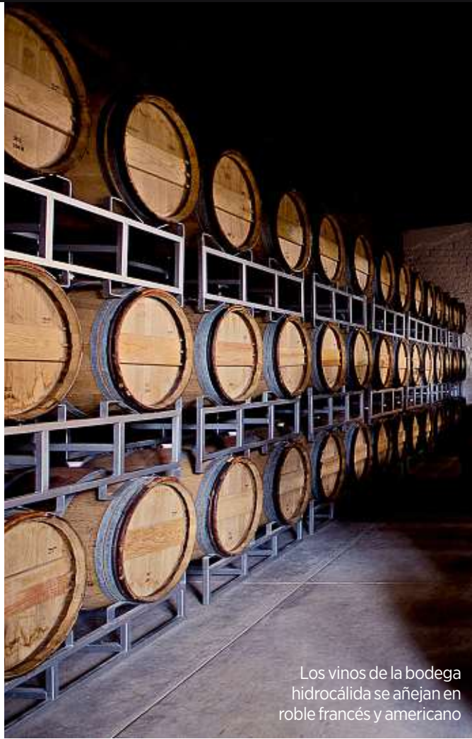
Los vinos de la bodega hidrocálida se añejan en roble francés y americano

“Tenemos las temperaturas, los tipos de suelo y los regímenes pluviales adecuados, todo está muy bien para seguir desarrollando esta zona. Somos aproximadamente 25 proyectos en San Miguel de Allende, Comonfort, Guanajuato y Dolores Hidalgo”.